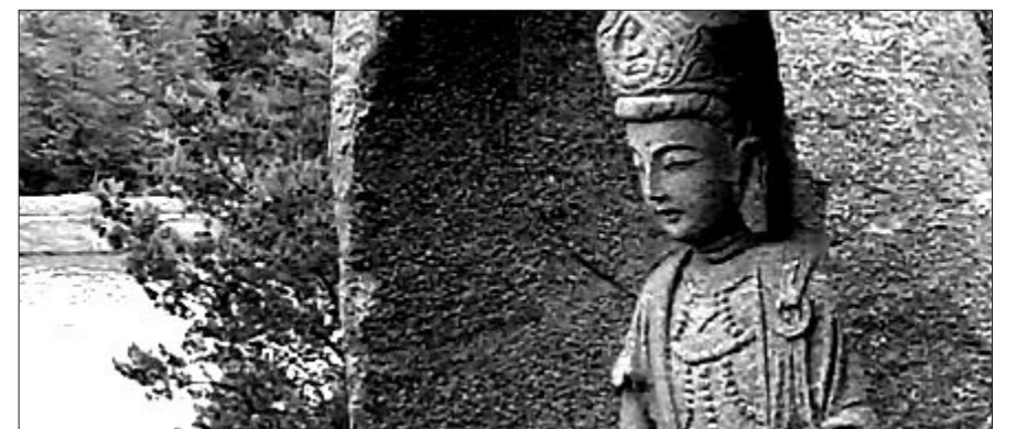
캐나다 온타리오에 북미지역서 가장 큰 규모의 중국계 불교사원이 드러서게 된다. 사진은 호수 주변에 있는 불상.