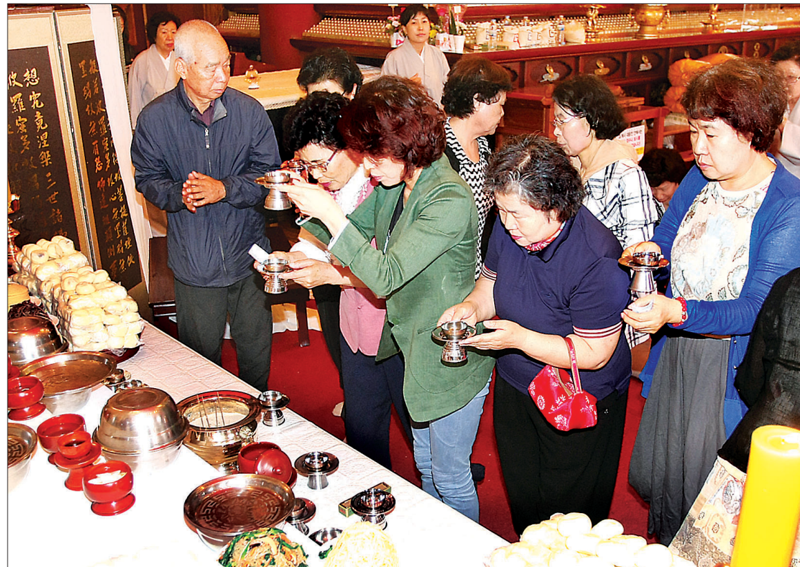
세월호 침몰 사고 49일을 맞은 6월 3일 전국 주요 사찰에서 49재가 봉행됐다. 서울 종로 조계사에서 열린 49재에 참가한 사부대 중이 헌화를 하며 영가의 극락왕생을 기원하고 있다.