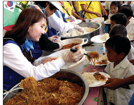
동국대 참사랑 봉사단

1997년 창설된 참사랑봉사단은 지역 봉사활동은 물론 2000년부터 미얀마, 스리랑카, 인도네시아, 필리핀, 캄보디아 등지에서 의료 및 문화봉사 활동을 해오고 있으며 2007년부터 매년 필리핀 리가오 지역에서 사랑의 집짓기, 학교담당페인트칠, 마을 환경 정화 등 국제봉사활동을 펼쳐왔다. 필리핀 리가오 시에서는 2008년 ‘동국대학교 거리’를 현지에 조성할 정도로 높은 호응을 얻었다. 특히 캄보디아· 라오스· 미얀마 등에서 열리는