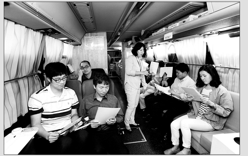
개칭 15주년 기념식에 이어 단체 헌혈에 나선 문화재청 직원들의 모습. 문화재청은 각 국 별로 봉사활동을 전개하기로 결의했다.

박 교수는 "현대인들에게 효과적으로 수행법을 전하기 위해 제시한 것이 바로 염불선이라며 현대 불교계가 이러한 수행법을 보다 활발히 활용할 필요가 있다"고 말했다. 노덕현 기자 noduc@hyunbul.com