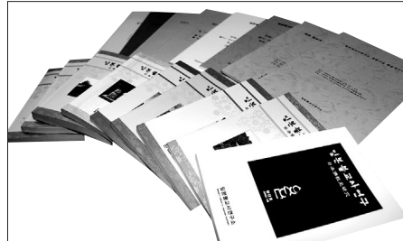
일본불교사연구소가 그동안 펴낸 자료집

학자들이 그동안 자신이 연구한 일본불교 논문을 연구소를 통해 발표했다. 또 △일본서적 번역 및 장학사업, 일본불