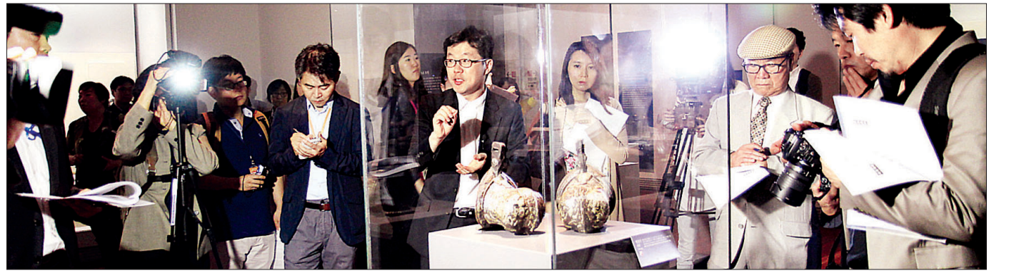
국립중앙박물관이 선사고대관 통일신라실을 새롭게 단장 일반 관람객들에게 선보인다. 사진은 5월 19일 언론 공개회 장면.

철불 배치는 통일신라 불국토의 세계를 입체적으로 표현, 일주문을 통과해 사찰로 들어가는 길을 연상케 했다. 국립중앙박물관은 “전시장 입구를 사천왕, 보원사 철불, 경주 출토 팔부중앙 손으로 배치 일주문에