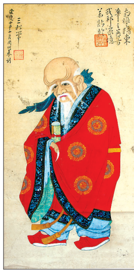
명나라 목판화 '수성노인도'

특히 이번에 최초로 공개되는 명 용경 임신년(1572) 작품인 대형 ‘수성노인도’는 세계적으로도 희귀한 연화로 고판화박