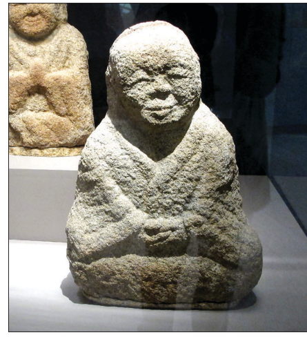
영월 창령사 절터에서 발굴된 나한상

국립춘천박물관이 테마전 '부처와 나한의 미소'전을 올연말까지 개최한다. 미소를 띤 친숙한 불교 조각상은 전시 관람객들에게 마음의 평화와 위로를 전해줄 것이다. 국립춘천박물관은 “세월호 참사로 온 국민이 아픔과 고통에 잠겨 있는 이 어려운 시기에 불교의 가르침을 통해 마음의 위안을 얻고, 부처님께서 설하고자 하는 진리가 무엇인지 다시 한번 생각해 보는 계기를 마련하고자 했다”고 전했다.