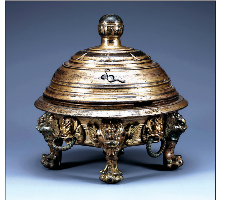
익산 미륵사지 출토 향로

미국 메트로폴리탄박물관서 호평 받았던 '보원사 철불' 등 통일신라 중대대 역사 한눈에