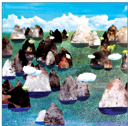
김명규 작가의 'One day on dream'