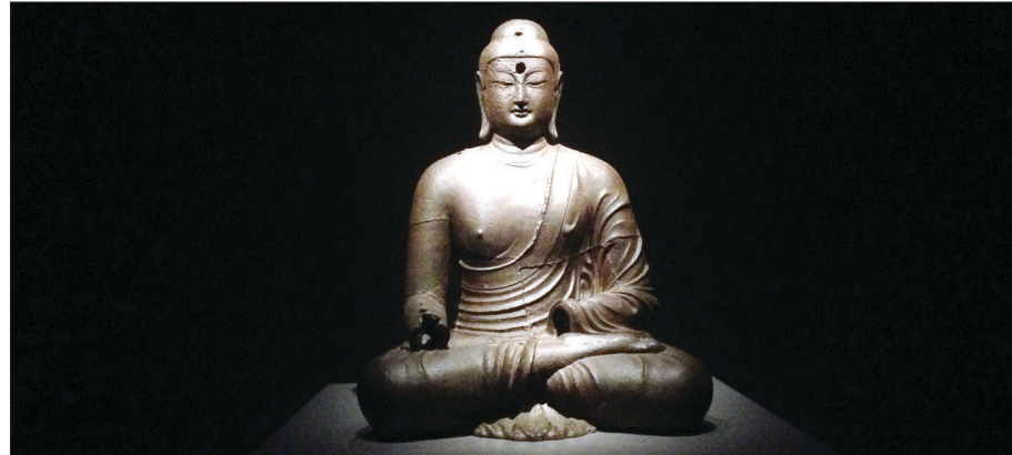
통일신라실 절반의 공간을 확보해 전시하는 보원사 철불은 2013년 미국 메트로폴리탄박물관에서 열렸던 '황금의 나라, 신라' 전에서 호평을 받은 바 있다.