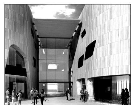
우즈 베이곳이 지난해 울런공대학 내 건축한 6,000 평방미터 규모의 학생회관 전경

"울런공 시와 난티엔 사원의 협에 따라 들어설 복합시설은 4,600 평방미터에 걸쳐 건설되는데, 항우 울런공 시의 '문화·연구센터'의 대사회적 역할을 키우는 데 크게 일조할 수 있을 것"이라고 밝힌 우즈 베이곳의 디자이너 조지아 싱글턴(Georgia Singleton) 씨는 "복합시설 인근에는 지역 거점 대학인 울런공대학이 있는데, 특히 이곳의 재학생들이 복합시설을 이용하며 새로운 커뮤니티, 즉 인드라망을 형성할 것으로 기대하고 있다"고