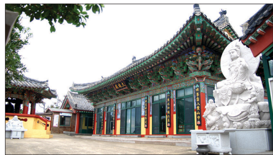
미륵부처님을 모신 동암사 정경