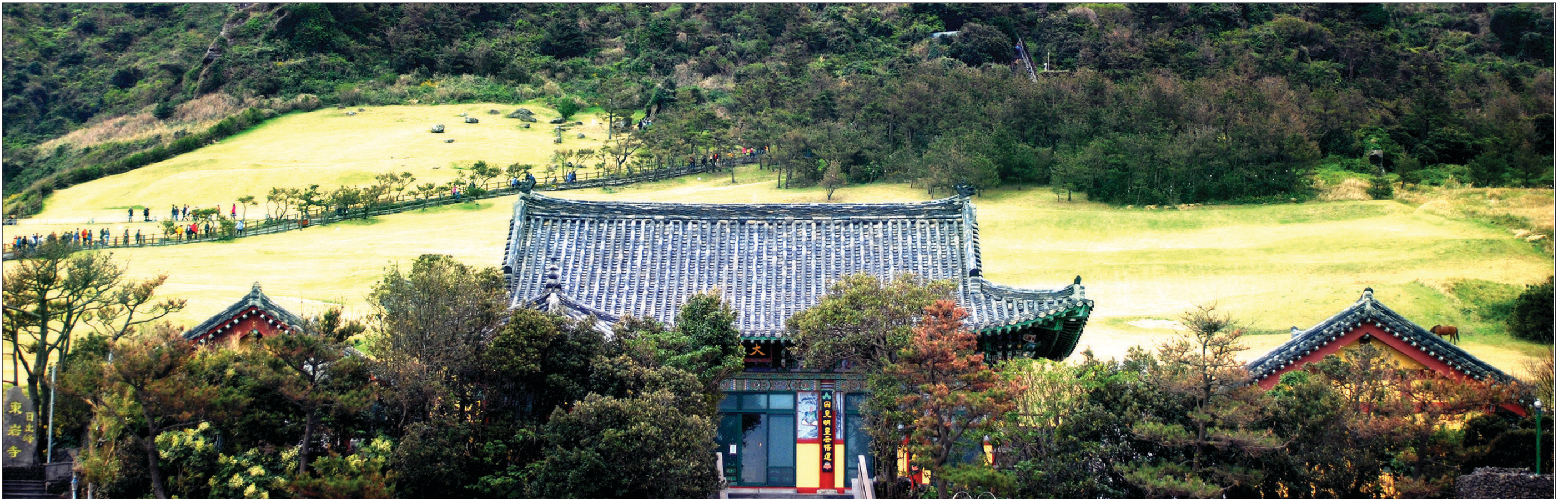
성산일출봉은 제주를 물론 세계의 큰 유산이 됐다. 그 중턱에 자리한 사찰이 바로 동암사다. 드넓은 잔디밭에 좌대를 둔 동암사는 성산일출봉을 찾는 불자들이 참배하기엔 더욱 안성맞춤이다.