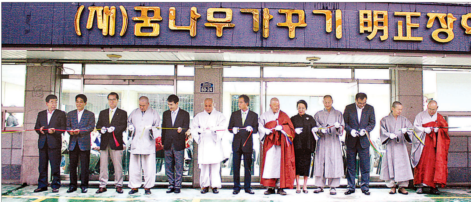
원오사가 5월 20일 반송 2동에 꿈나무 공부방을 개소했다. 앞으로 꿈나무 공부방은 지역아동·청소년들의 꿈을 지켜주는 보금자리가 될 것을 약속했다.