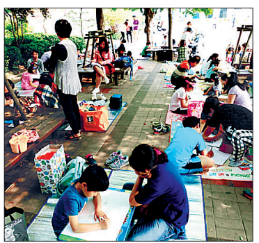
효사랑 글짓기 지난해 행사 장면

공모대상과 주제는 △초등부 1~3학년(그림)-부모님과 행복했던 시간 △초등부 4~6학년(포스터)-과거와 현대사회의 효 △중·고등부(글짓기)-내가 바라는 효, 내가 생각하는 노인학대(중 택1) 등 청소년들의 창의적인 생각이 반영된 작품이면 가능하다. 공모를 통해 부산시장상, 부산일보사장상, 국제신문사장상, KBS사장상, KNN사장상, 부산시사회복지협의회장상, 노인보호전문기관장상이 초·중·