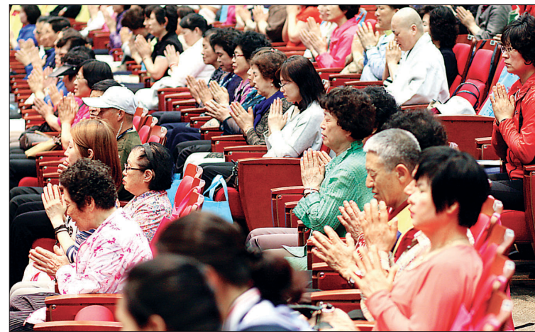
보리선수 부산약사선원은 5월 21일 백스코서 현대인의 심신치유를 위한 '약사여래불가피대법회'를 열었다.