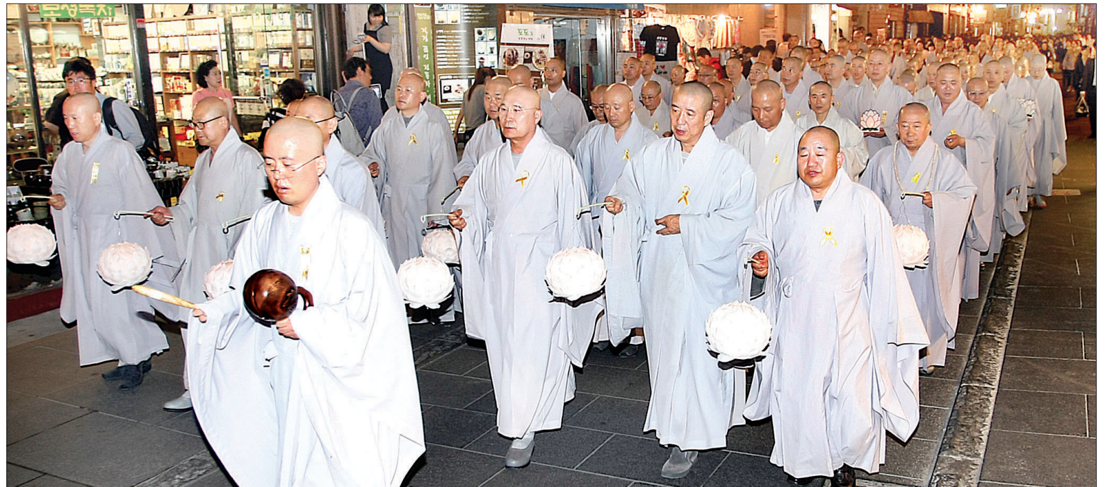
조계종은 5월 20일 서울 종로 조계사에서 세월호 희생자를 위한 추모재를 봉행했다. 사진은 종로 일대에서 추모행렬을 하고 있는 모습.