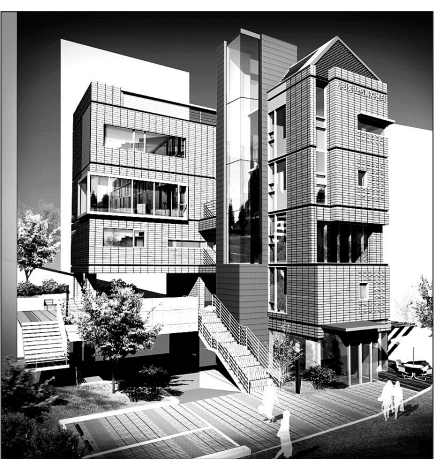
5월 16일 개관된 종로노인종합복지관 무악센터의 조감도

2012년 12월 착공해 1년 6개월만에 개관하게 된 무악센터는 종로노인종합복지관이 운영하며 운영법인은 조계종사회복