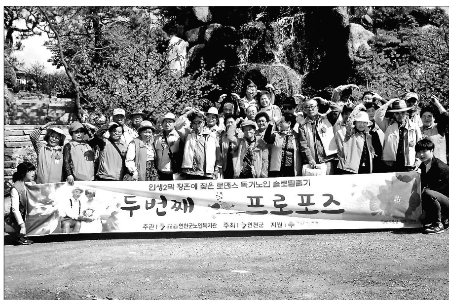
포천 허브아일랜드에서 진행된 황혼미팅에 참가하고 포즈를 취하고 있는 어르신들.