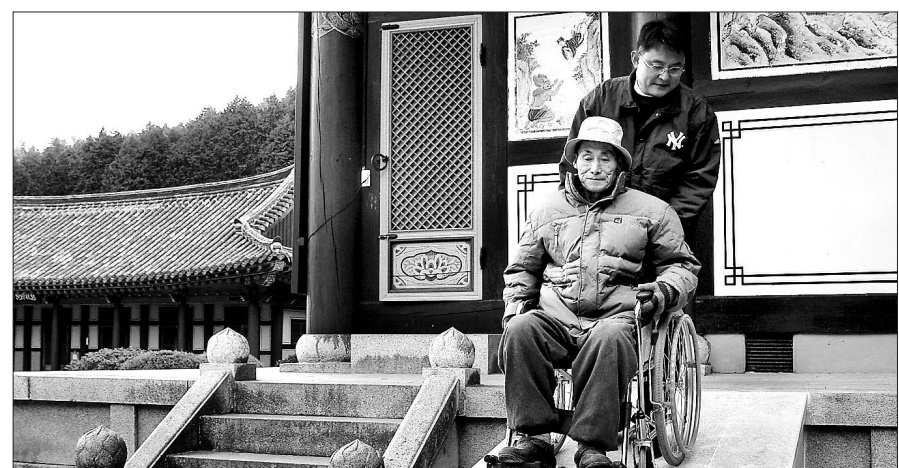
장애인이 사찰에 마련된 경사로에 의지해 휠체어를 타고 이동하고 있다