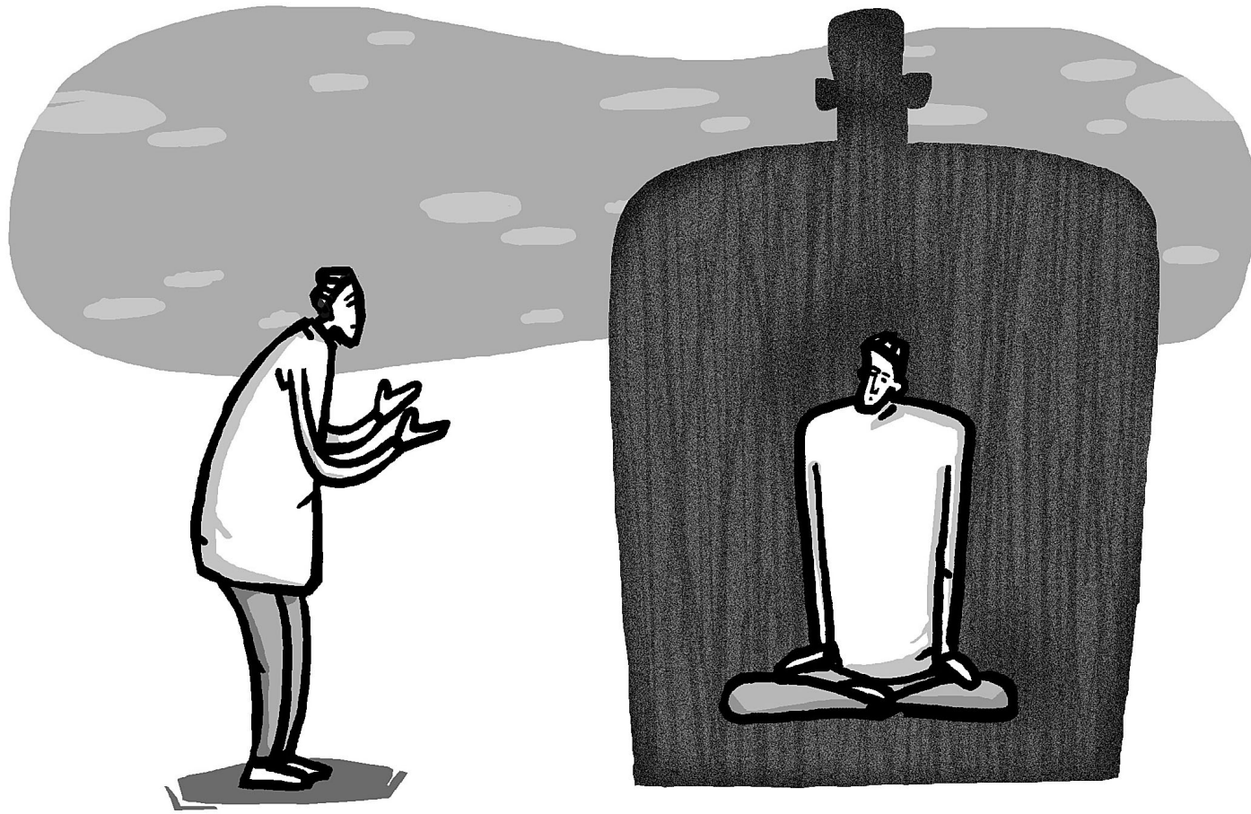
그림 · 최주현

그래서 자기 주인공에다가 어떠한 화나는 일이 됐더라도, 약한 일이 됐더라도, 부작용이 일어난다 하더라도 그 용도에 따라서 항상 '내 속에서 화가 나는 거니까 내 속에서 화를 안 내게 하는 거 아니야?' 하고 되풀이해서 놓는다. 일체를 닥치는 대로 말합니다. 일부러 쫓아가면서 할 필요는 없지만 내 안에 닥치는 것도 각중해 달하니까. 진짜로 자기를 누가 이끌고 지금 갑니까. 대신 이끌어 주는 사람도 없고 대신 먹어 주고 죽여 주고 아파 주고 또는 똥 뉘 주고 잠자 주고 그럴 사람 하나도 없죠. 자기 뿌리만이 자기를 위해서 모든 에너지를