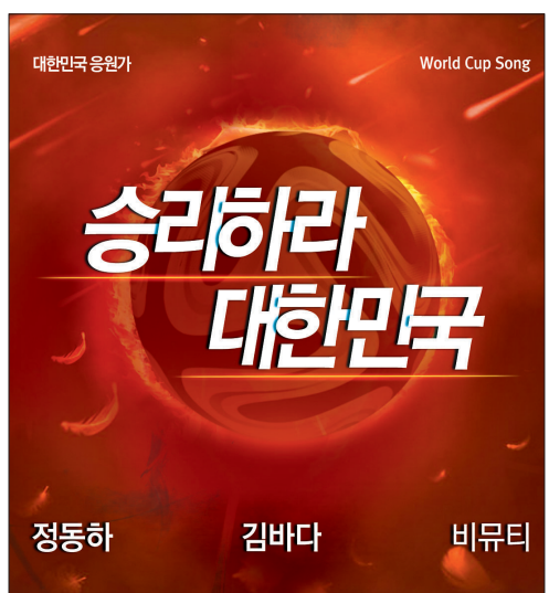
‘승리하라 대한민국’ 앨범 자켓