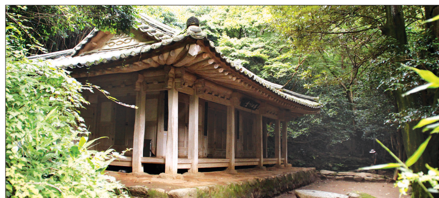
정약용이 강진으로의 유배 당시 머물렀던 다산초당. 백련사 동백 숲길을 걸어 900여 미터 지점에 있다.

다산이 쓴 혜장스님의 탐명(塔銘)에 “하루는 내가 야로(野老)를 따라 신분을 감추고 가서 그를 만나 그와 더불어 한나절까지 이야기했으나, 내가 누구인지를 알지