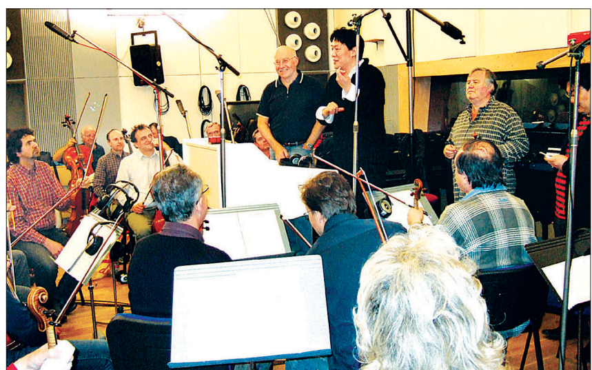
1집 녹음 당시 첼코필하모닉오케스트라와 함께.