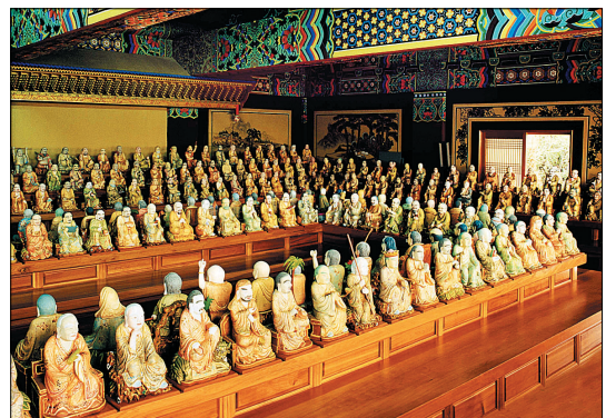
대적광전에 모셔진 나한전