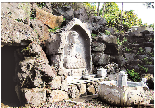
굴법당 입구에 모셔진 약사여래불