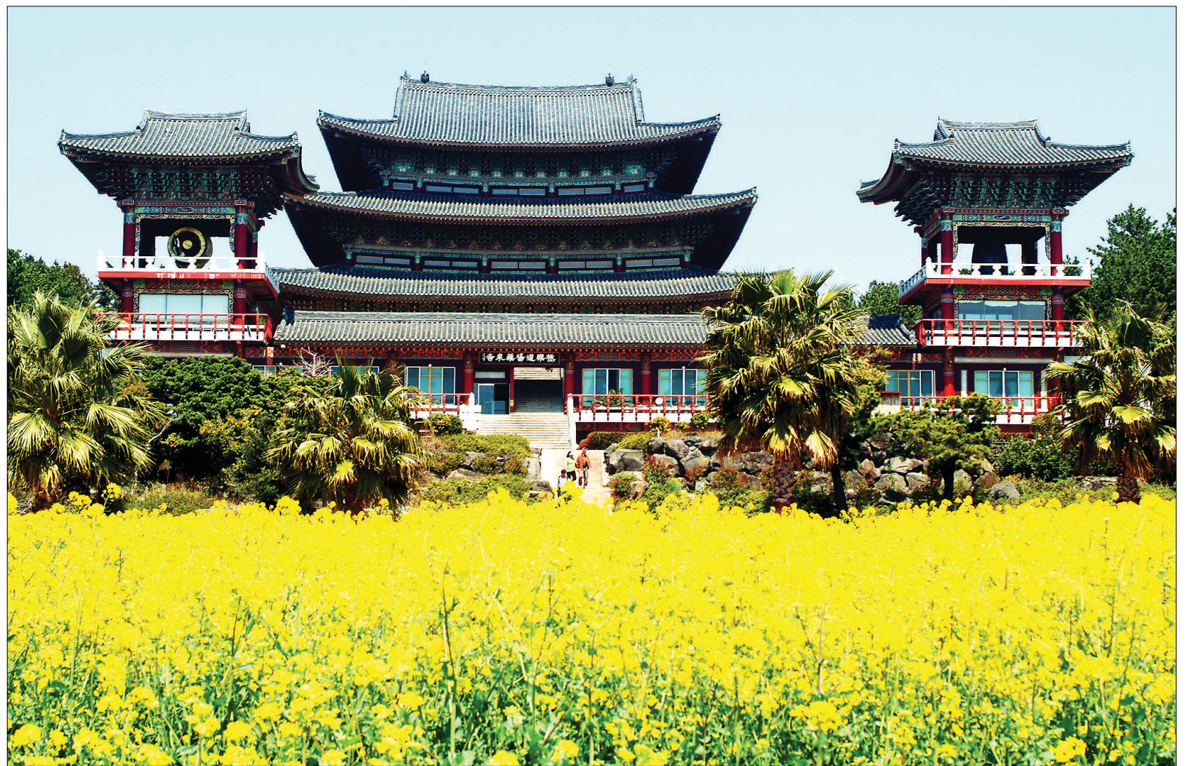
서귀포시에 위치한 약천사 앞마당에는 너울거리는 노란 유채꽃이 아름다운 자태를 뽐내고 있다. 특히 주변 아자수와 어울려 남국의 이국적인 정취를 풍긴다.