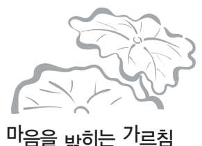
마음을 밝히는 가르침