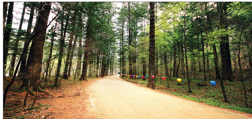
월정사로 들어가는 천년의 숲길. 조선의 선비들이 사랑하여 그들의 시에 자주 등장했다.

이 시의 제목은 알 수 없다. 지은이는 박광우(朴光祐 1495~1545)로 을사사화 때 화를 입어 젊은 나이에 죽은 선비다. 이 시는 이익(李瀾)의 <성호사설(星湖僿說)> 제30권 ‘시문문(詩文門)’에 소개되고 있다.