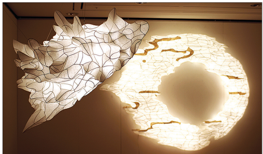
빛이 머물다 III 빛이 머물다 II -2(조계종 총무원 소장)