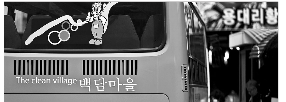
백담사는 어려운 마을의 공동체 형성과 지역경제 활성화를 위해 버스 사업권을 넘겨 2013년 16억원의 매출을 기록했다.

겨주었고, 주민들은 2011년 '용대2리 주민백담마을 영농조합법인(백담마을기업)'과 '용대향토기업' 등 2개의 마을기업을 출자해 만들었다. 그 결과 백담마을기업은 2013년부터 지역특산물인 황태와 마가목