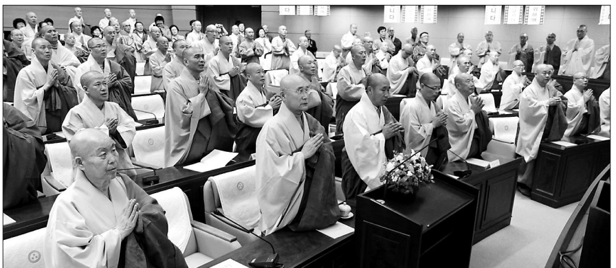
2012년 조계종 전법단 출범 2주년 기념 세미나 및 기념법회 모습. 계층 포교를 위한 포교 자원 개발은 꾸준히 이뤄져야 할 숙제이다.