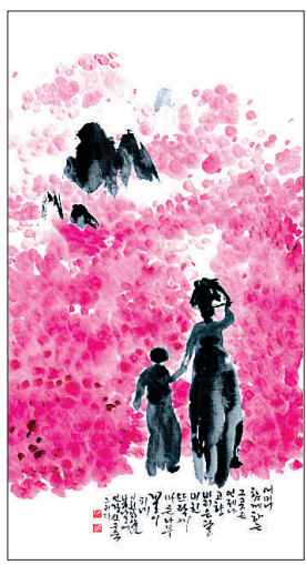
신은숙 작가의 '아우유지향'

작가는 어린시절 추억을 그림으로 담아냈다고 설명한다. "어려서 열병으로 학교에 가지 못하고 집에서 앓고 있었습니 다. 부모님은 밤에 나가시고 혼자 마루에 나와 힘없이