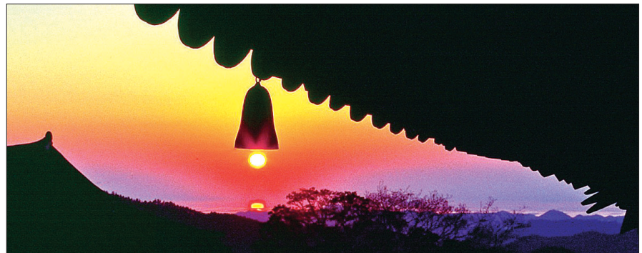
한국불교사진협회가 풍경을 주제로 19회 회원전을 연다.