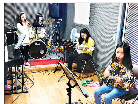
청량사 어린이 밴드 꼬마풍경 연습 장면