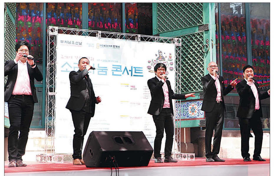
봉축을 맞아 전국 각지에서는 부처님의 법음을 전하는 다양한 음악회가 열린다. 사진은 도심 조계사에서 점심 시간 여는 소리나눔콘서트.

청량사 동근소리합창단은 5월 1일 오후 7시 경북 영주시 영주시민회관 대강당에서 제1회 정기연주회를 개최한다. 첩첩산중 시골마을 절에서 어린이밴드와 함께 창단 축하회를 모았던 동근소리합창단은 정기 연주회를 통해 그동안 갈고 닦은 실력을 뽐낼 예정이다. 그동안 절 안팎으로 봉사하며 신