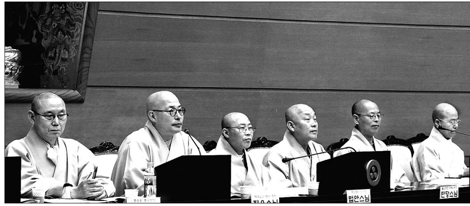
조계종 총무원장은 4월 16일 총무원장 선거제도 개선 공청회를 개최했다. 사진은 주요 발제자와 토론자들이 진행한 종합 토론 모습.

특히 토론에서는 법계 제한 직선제와 추대제에 대한 주장과 제안들이 나왔다. 중앙종회 총책모임 불교광장 총책위원장 만당 스님은 “종단을 구성하고 있는 중요한 요소는 3천여 말사”라면서 “말사 주지는 10년차 중덕·정덕 법계부터 가능하다.