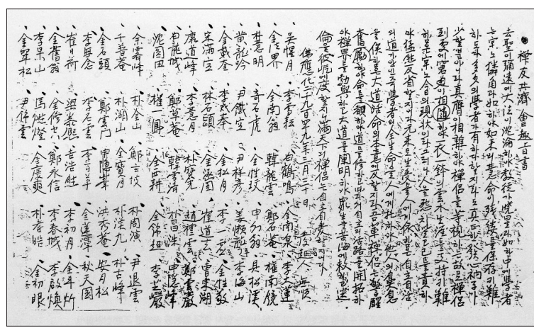
1973년 중창된 현재 선학원 중앙선원의 전경(사진 위)과 초기 선학원의 모습(사진 아래 왼쪽) 그리고 수좌의 자립을 위해 만들어진 선우공제회의 발기문(사진 아래 오른쪽). 만해 스님은 선학원과 선우공제회 창립에 깊숙이 관여했다.

로 잡기 위함이기도 했다. 당시 한국불교의 선 수행의 상황은 만해 스님의 논저 <조선 불교유신론(朝鮮佛敎維新論)>에서 적나라하게 찾을 수 있다.