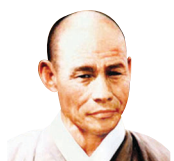
만해 스님 열반 70주년 ‘만해의 길을 가다’