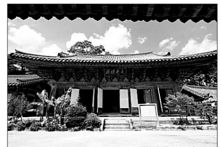
보물로 지정된 양산 통도사 대광명전

‘양산 통도사 영산전’은 정면 3칸, 측면 3칸의 다포계 맞배지붕으로, 정면과 동 측면의 기단은 지대석 위에 면석을 놓고 갑석을 덮어 마감한 형태이며, 기단의 정면 중앙과 양 측면 앞쪽에는 계단이 놓여 있다.