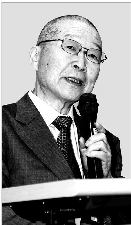
학제간 연구 강조 “사회맥락 알아야”