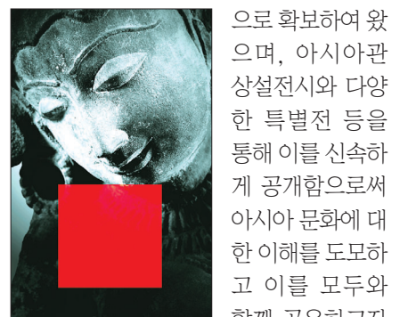
으로 확보하여 왔으며, 아시아관 상설전시와 다양한 특별전 등을 통해 이를 신속하게 공개함으로써 아시아 문화에 대한 이해를 도모하고 이를 모두와 함께 공유하고자 노력했다"며 취지를 설명한다.

국립중앙박물관은 "용산의 새 박물관 이전개관에 따른 아시아부의 신설과 아시아관 전시의 내실화를 위해 꾸준히 구입한 문화재를 체계적으로 소개하는 자리다. 그동안 국립중앙박물관은 구입과 수증을 통해 아시아 관련 문화재를 지속적