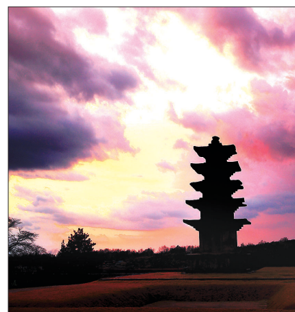
고외숙의 '왕궁리 5층 석탑'

심상은 "아름다운 산사와 기나긴 세월 그 자리를 지켜온 오랜 역사가 깃든 여러 사지를 찾고 또 찾아 그 곳에서 만나는 탑을 주제로 했다. 섬세함으로 때론 웅장함으로 친숙함으로 서 있는 아름다운 조형물을 보며 오랜전 세월 그들의 염원도 우리의 염원도 나의 염원도 함께 교감하며 느끼는 귀한 시간들이 되길 바란다"며 전시를 여는 취지를 설명했다. 우리문화재의 우수성과 예술성, 아름다