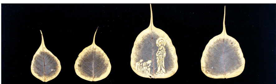
'84·14 동행'전에 참여하는 박경귀의 '보리수 숲'

입학 30주년을 맞아 동국대 미술학과 84학번동기들이 인드라마 프로젝트의 일환으로 '84·14 동행'전을 4월 18일~20일 삼정동 스페이스+에서 연다.