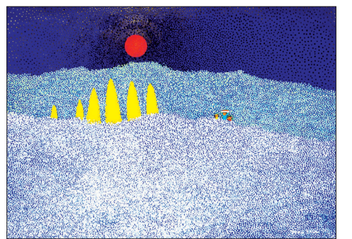
점을 찍어서 완성한 산사의 풍경을 소재로 한 회화 작품은 신비로운 분위기를 연출한다. 위에서부터 시계 방향으로 '산사에 눈이 내리면' '고향의 아침' '나를 찾아' 순.