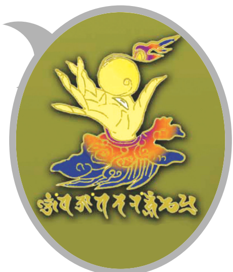
42수진언 족자 중의 '여의수주 진언' 확대사진