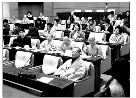
불교상담개발원은 3월 29일 ‘2014 자살위기상담교육’을 개최했다.

행사는 불교상담심리사와 외부참가자 등 70여 명이 참가했으며, 1부에서는 불교상담심리사에 대한 자격유지관리요건과 불교상담심리사1급 취득에 필요한 조건과 방법, 그리고 현재 불교상담개발원에서 진행 중인 전문상담사 사업(어르신 상담팀, 군 전문상담팀, 교정교화봉사팀, 노동자심리상담센터 ‘도반’, 여성가족 부공모사업)에 대한 설명이 소개됐다.