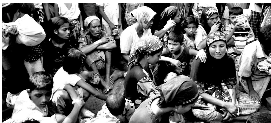
미얀마 서부에 거주하는 무슬림계 소수민족인 로힝야족.

족 사이의 종교 분쟁으로 200여명이 숨지고 14만여명의 난민이 발생한 일도 있었다. 이런 상황에서 미얀마 정부는 로힝야족도 인구조사에 포함시키겠다는 약속을 파기했다.