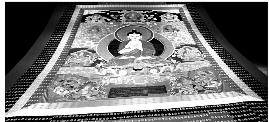
탕카. 티베트 탕카(thangka). 이번 전시회에는 관람객의 발길을 잡았던 탕카는 6.1미터에 달한다.

미국 로스앤젤레스에서 히말라야 불교미술을 조망할 수 있는 전시회가 성황이다.