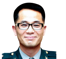
정행이익수 군송법사 (육군학예연구소 학예사 주지)

활발한 활동을 하던 배 상병은 이후 제가 그 부대를 떠나고 두 달쯤 후에 전역을 했습니다. 전역 이후에는 연락이 뜸하지만 어디에선가 불자로서 활동하고 있을 생각을 하니 가슴이 뿌듯합니다.