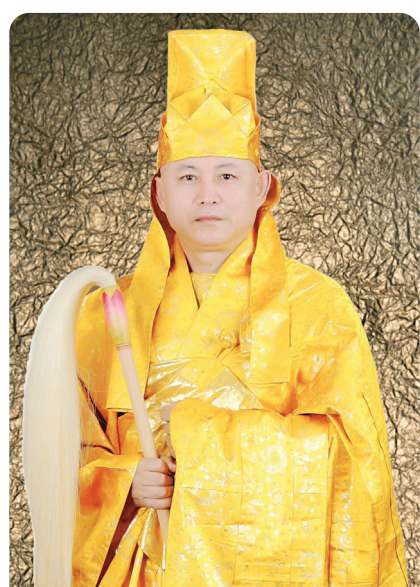
석가여래부촉법 제 77세 청봉 석정산 대종사