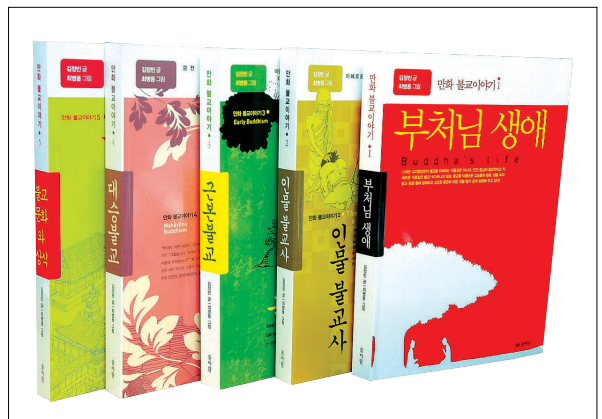
동출 스님은 20년간 어린이·청소년 뿐 아니라 성인들에게도 유익한 불교만화 17권과 70여 권의 불서를 펴냈다.