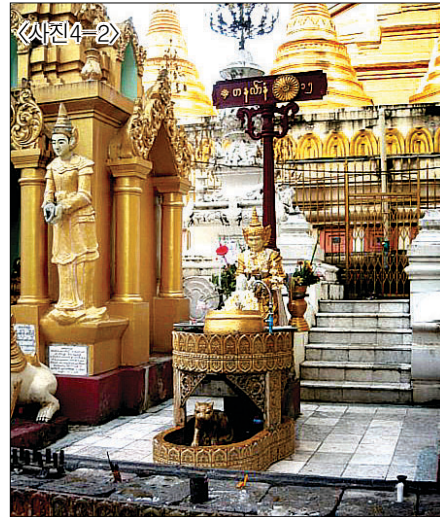
<사진4-2> 월요일을 상징하는 호랑이 상.