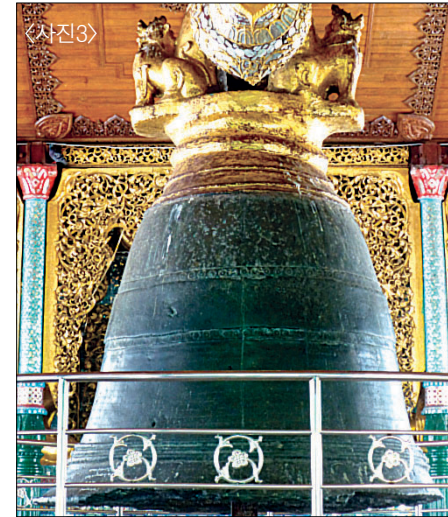
<사진3> 1779년 썬우왕이 보시한 종.