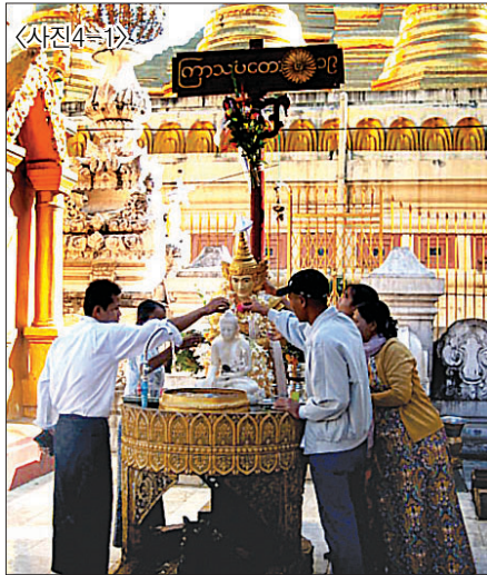
<사진4-1> 본인 탄생 요일에 욱복하는 모습