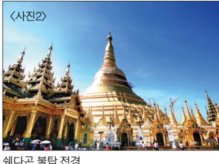
<사진2> 쉐다곤 불탑 전경

를 녹여 전체를 황금으로 덧씌워져 있다. 특히 탑의 상부에는 다이아몬드 5,448개, 루비, 사파이어, 토파즈 등 각종 보석 수만개로 장엄하였다. 여기에 금종 1,065개, 은종 420개를 봉안하니, 미얀마 국민들은 물론 전 세계 불자들의 제1성지로 꼽히는 손색이 없다. 물론 초기의 쉐다곤 불탑은 높이 약 22m로 지금 보다는 규모가 작았지