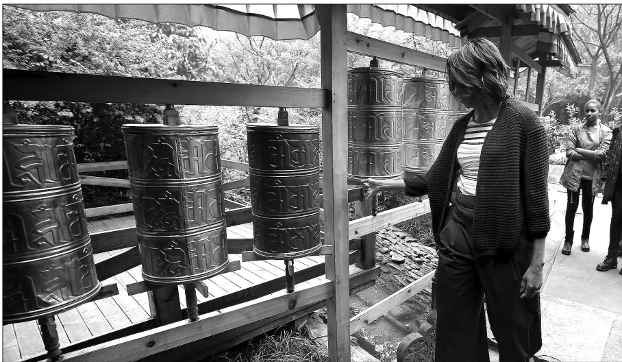
최근 중국을 방문한 미셸 오바마가 운장대를 돌리고 있다.

미셸이 방문한 식당이 진짜 티베트 식당이 아닌 티베트자치구 정부 청두 사무처가 운영하는 관영식당이며 당시 현장에 있던