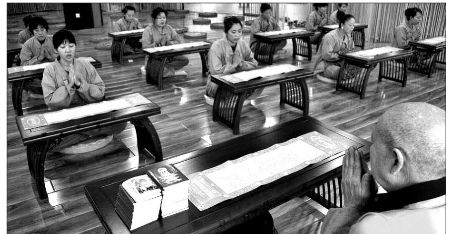
불교 명산 우타이 산의 선 테마 호텔

유네스코 세계유산으로 지정된 중국의 불교 명산 우타이(Wutai, 오대) 산에 6월 중 선(禪) 테마 호텔이 오픈한다. 〈People's Daily(인민보)〉지는 3월 24일 "산사에서 생활하는 불자들의 황토색 법복을 유니폼으로 입은 직원들이 로비에서 투숙객을 맞을 '우타이 선 호텔(Wutai Zen Hotel)'에서 투숙객이라면 누구든지 언제나 향을 피우며 예불을 올리고 채식하는 것은 물론 스님의 법문도 들을 수 있을 것"이라고 보도했다. 〈People's Daily〉지에 따르면 오는 6월 중 오픈할 '우타이 선 호텔'은 500여 명이 동시에 투숙할 수 있는 대규모 호텔 객실, 레스토랑, 산책로 등 모든 시설이 선을 주제로 설계되었다.