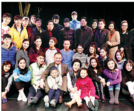
공연을 끝내고 제자들과 함께 한 기념촬영.

이런 그의 행보는 여전히 바쁘다. 5월 서울 강동아트센터에서 그가 창작한 '살꽃 바람꽃 V, 눈길'로 다시 한번 무대에 오르려는가 하면, 6월 남원 공연에 이어, 8월에는 아르헨티나에서도 공연을 갖는다. 정년이라는 나이가 무색할 정도로 왕성한 활동을 펼치고 있는 그는 10년 후에도 무대에 서고 싶다는 수줍은 웃음을 보인다. "아직도 하고 싶은 게 많아요. 우선은 좋은 작품을 끊임없이 만들어 가고 싶어요. 불교 콘텐츠를 대중화한 작품도 만들어보고 싶어요. 예술가에게는 정년이 따로 없으니까요. 또 재능기부를 통해 세상에 기여할 수 있는 일도 찾아보고 싶구요. 자신할 수 없지만 10년 후에도 건강만 허락한다면 무대에 서고 싶습니다." 글=정혜숙 기자 bwjhs@hyunbul.com