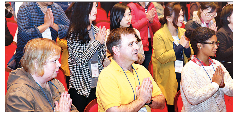
연등회 보존위원회는 3월 18일 ‘연등회 서포터즈’ 출범식을 열었다.