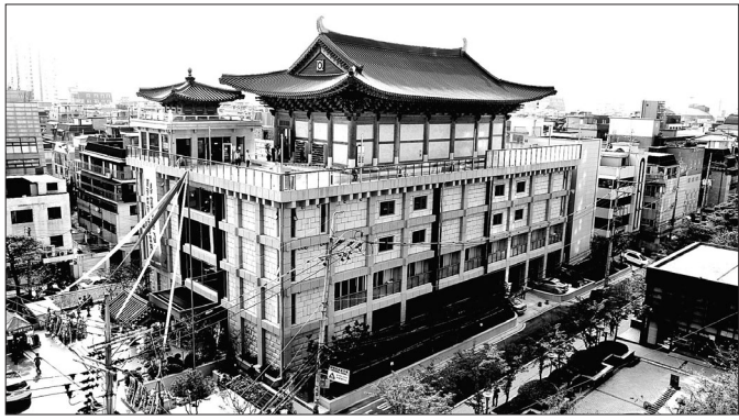
지난해 10월 완공된 잠실 불광사 신축법당 전경.