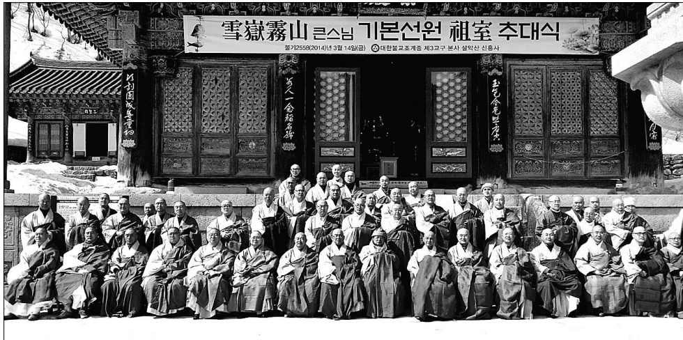
신흥사는 3월 14일 '백담사 기본선원 지정 개원 및 조실 추대식'을 봉행했다.

이 같은 환경 조성은 복산 선맥을 계승하고 있는 설악 무산 스님의 월력에 기인한다. 스님은 백담사 무곡선원과 신흥사 향성선원을 개원한 데 이어 기본선원을 백담사로 일원화하는 등