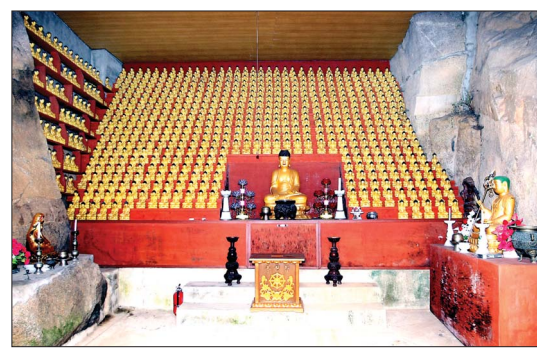
마애선각좌상이 새겨진 바위에 조성한 굴법당