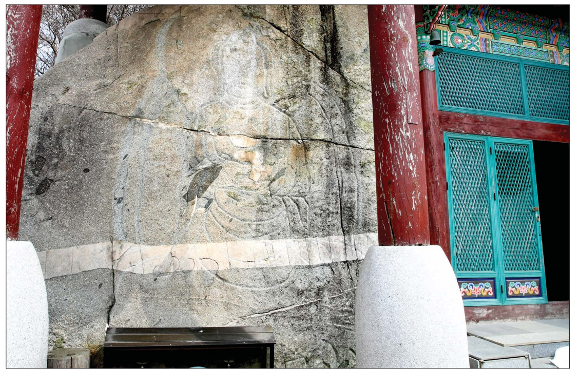
호암사 마애선각좌상(향토유적 12호)