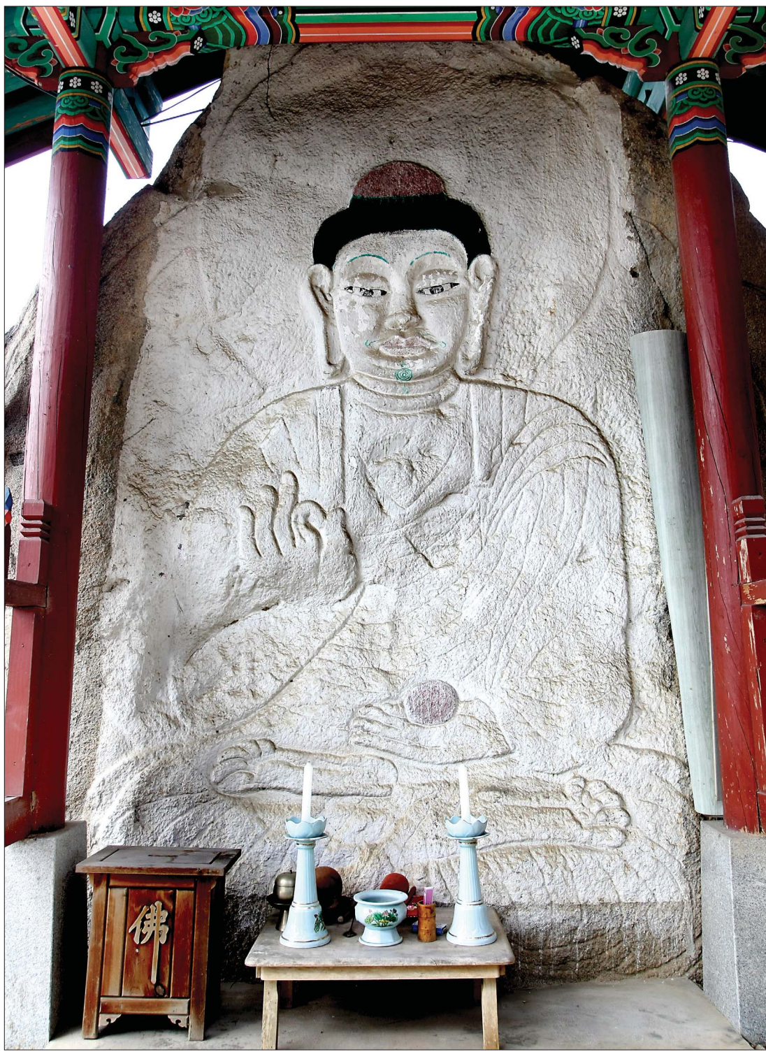
굴암사 마애여래좌상(안성향토유적 11호)

앞서 말한 시, ‘굴암사’는 조병화(1921~2003) 시인이 돌아가신 어머니를 추억하며 지은 시이다. 범명이 원형이었었던 시인의 어머니는 그렇게 굴암사엘 다녔고, 시인은 보통학교 때 굴암사로 소풍(원적)을 갔다. 시인이 된 소년은 훗날 어머니가 걸었던 그 길을 되밟으며 어머니를 추억한다. 시인의 추억은 한 편의 시가 되었고, 그 한 편의 시는 글자 한 자가 아쉬운 굴암사의 소중한 이야기가 한 편이 됐다. 그리고 그 소중한 이야기를 남기고 또한 역사가 된 시인은 굴암사에 발자국을 남겼다. 시인의 발자국을 밟으며 도량으로 들어서면 허전한 역사만큼 도량 역시 그 허전한 역사를 그대로 보여준다. 그 시절을 이야기해주는 것들이 거의 없다. 연못가에 서있는 삼층석탑 한 기가 그 시절과 가장 가깝게 보이고, 전각은 최근에 지은 대응전이 전부다.