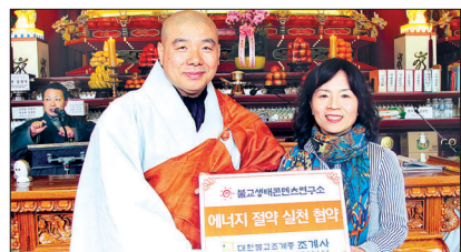
조계사는 3월 8일 대웅전에서 불교생태콘텐츠연구소와 협약식을 맺고 에너지절약 캠페인을 선포했다.

조계사는 3월 29일까지 1080명의 서명을 받는 것을 목표로 캠페인을 알려나가는 동시에 각 가정에서 실천한 인증샷 108개도 전시할 예정이다. 정혜숙 기자