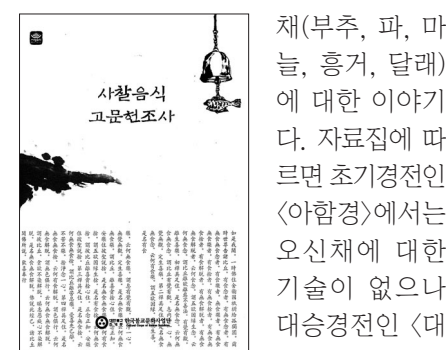
문화사업단, ‘사찰음식 고문헌 조사’서 밝혀

다양한 주제와 이를 뒷받침하는 경전의 근거들은 불교 교단의 음식문화의 변천을 알 수 있게 한다. 대표적인 예가 바로 오신