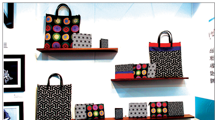
불교박람회에서 판매된 단청문양 디자인 제품들.