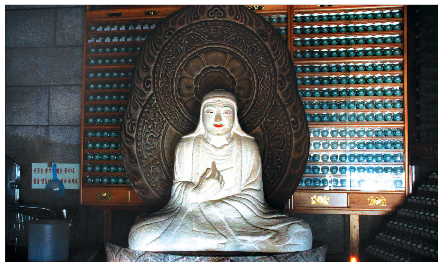
이덕무 등 조선의 선비들은 승가사를 자주 방문했다. 삼각산 승가사 승가대사상.

조선 후기의 실학자 이덕무(李德懋 1741~1793)의 시다. 이덕무는 박학다식했으나 서자라는 신분의 한계로 크게 등용되지는 못했다. 그러나 박지월, 홍대용, 박제가, 유득공, 서이수 등의 북학파와 실학자들과 교류했고, 기균(紀均)·이조원(李調元)·이정원(李鼎元)·육비(陸飛)·엄성(嚴誠)·반정균(潘庭筠) 등 청나라 석학들과도 교류하였다.