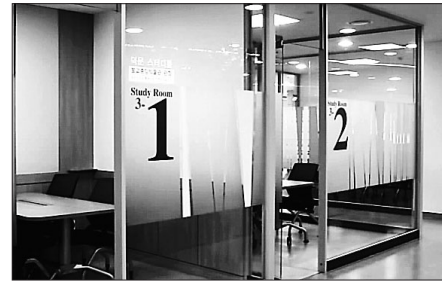
북카페로 변한 중앙도서관 지하1층 로비(위쪽 사진)와 3층에 마련된 IC ZONE 중 덕문세미나실(불교중앙박물관장 덕문 스님 기부)

네이밍 기준을 마련했으며 향후 기금구입 도서에 ‘Bookplate’를 부착해 도서기금 기부자를 표시하고, 도서 검색결과에 기부 내용을 표시하고, 내 기부금이 어떤 도서 구입에 사용됐는지도 표시하기로 했다.