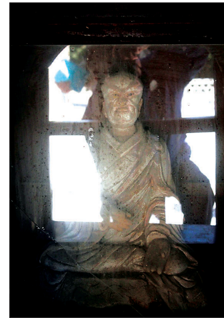
사리탑 내에 모셔진 원족 스님의 상(사진 왼쪽)과 탑에 새겨진 공적비문. 스님의 얼굴이 무섭게 표현된 것은 뛰어난 이방인에 대한 중국 사람들의 사색이 드러난 것이라 해석이 있다.