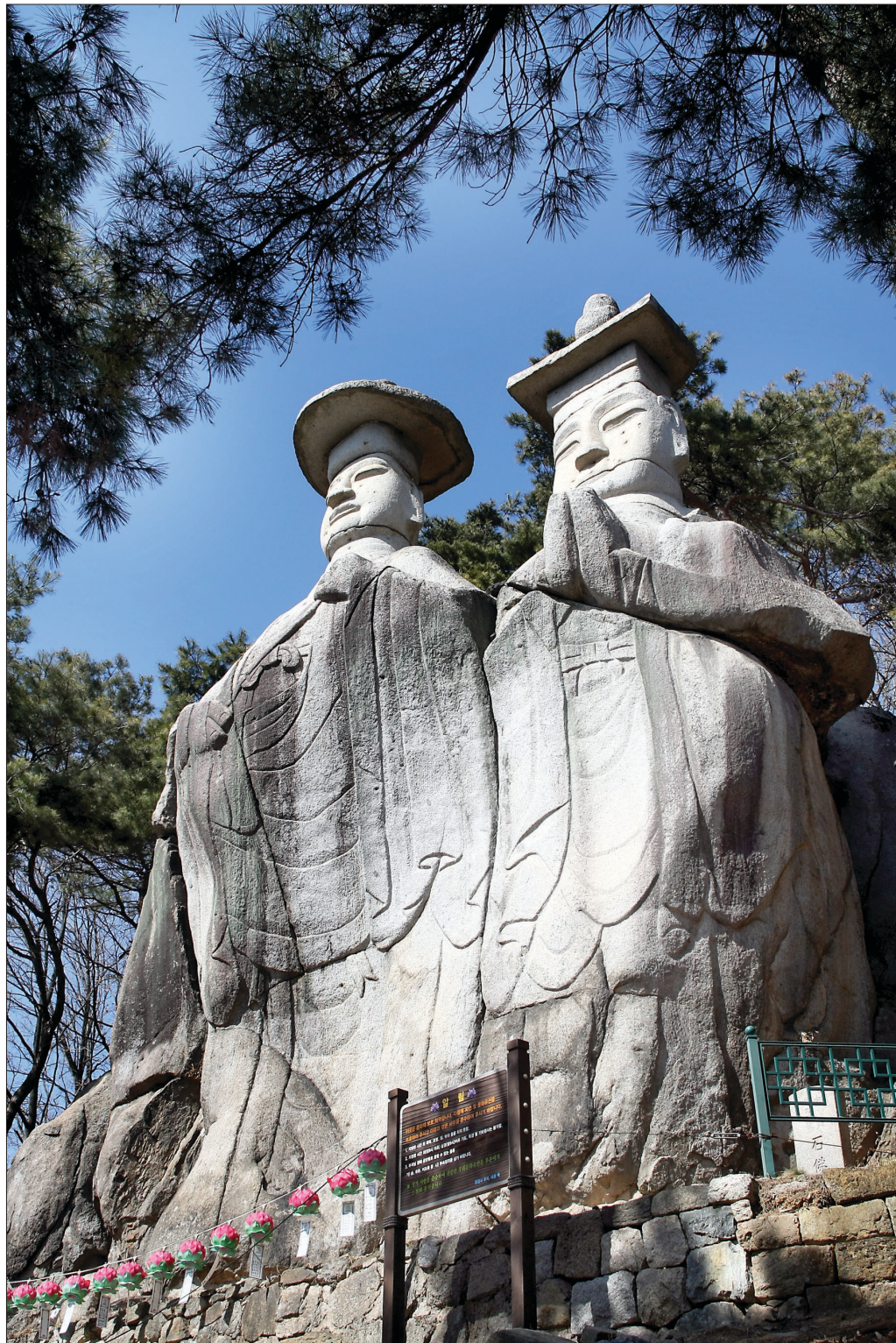
용미리 마애불입상은 천연 암벽에 불상 돌을 조각한 것이다. 오른쪽 석불은 사각형 모자, 왼쪽 석불은 등근 모자를 쓴 모습으로 '용미리 쌍미륵석불'이라고도 한다.