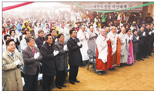
이날 1000여 대중이 모여 국운융성을 발원했다.