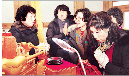
개산대제에 참여한 불자들이 진신사리를 친견하고 있다.