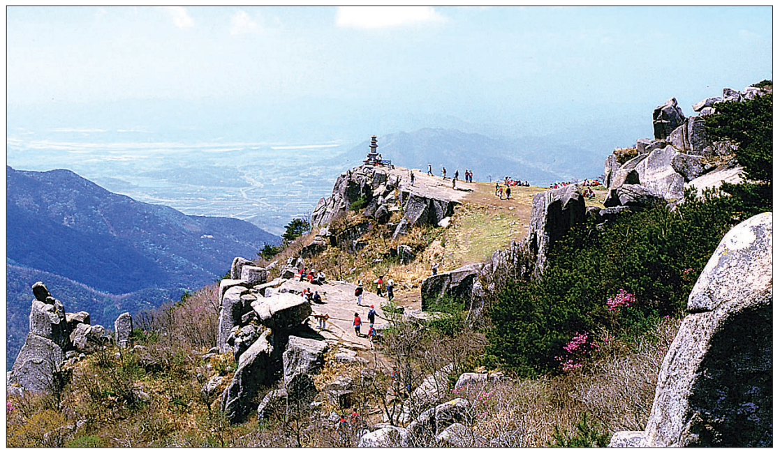
대견사에서 대마도 방향으로 자리한 석탑. 대마도를 견인하는 형국으로 일본의 기를 누른다고 하여 일제시대 강제 폐사됐다.

현재 대견사에는 복원된 3층석탑과, 10여명이 앉을 수 있는 동굴대좌(洞窟臺座)와 그리고 동굴대좌 입구 절벽에 유가종심인상(瑜伽宗心印像)이 선각으로 새겨져 있다. 절터에는 맑은 물이 솟아나는 샘터가 있으며, 가을 때는 달성군 사람들이 이곳에 와서 기우제를 지내고 있다.