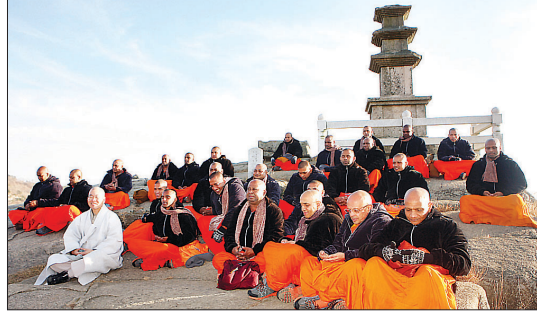
2013년 대견사를 찾아 진신사리를 봉안한 스리랑카 스님들