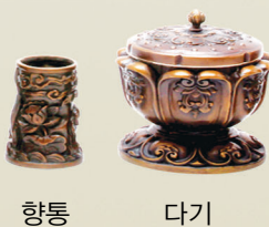
촛대(大) 촛대(中) 촛대(小) 향로 향통 다기