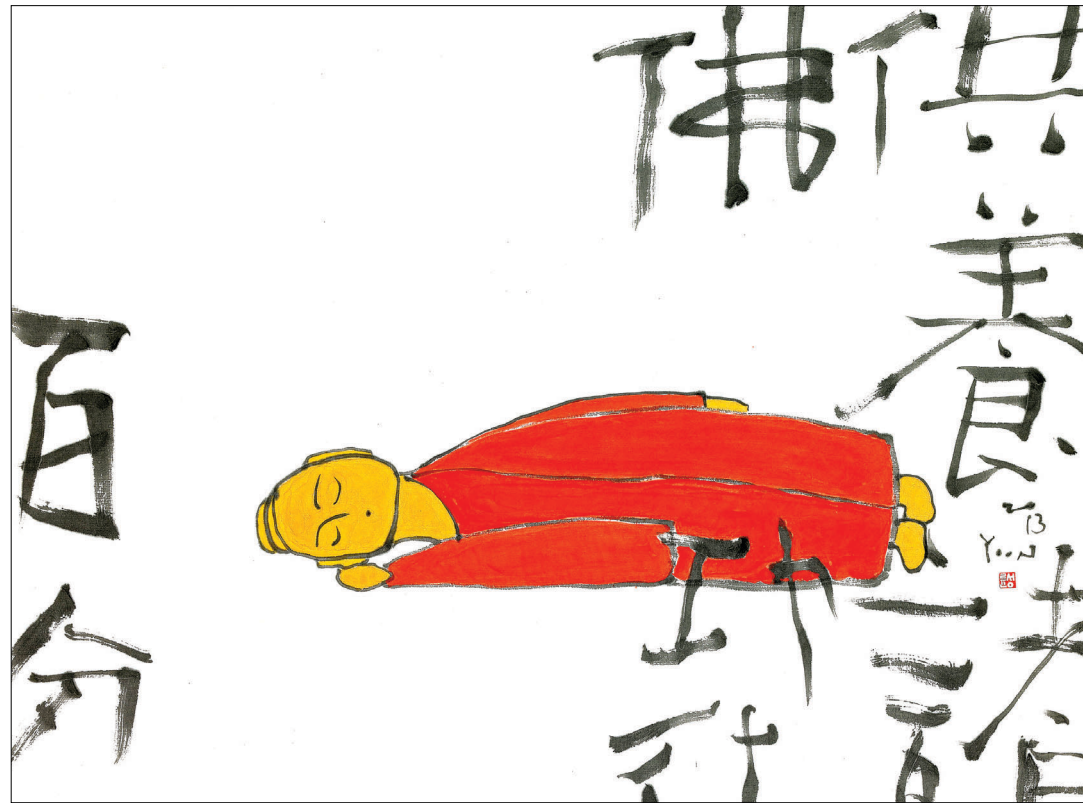
<공양제물 공행백본은 금강경의 경구>