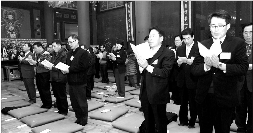
조계종 포교원(원장 지원)은 2월 24일 조계사 대웅전에서 경찰불자 신년법회를 거행했다.