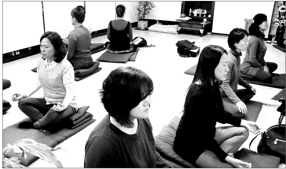
직장인들을 위해 저녁시간에 운영되는 수행 프로그램이 인기다. 사진은 위빠사나 붓다선원에서 진행한 위빠사나 수행. (현대불교 자료사진)

상좌불교 한국명상원은 매주 수요일 저녁 7시 12연기강좌와 사뭇쳐 위빠사나 수