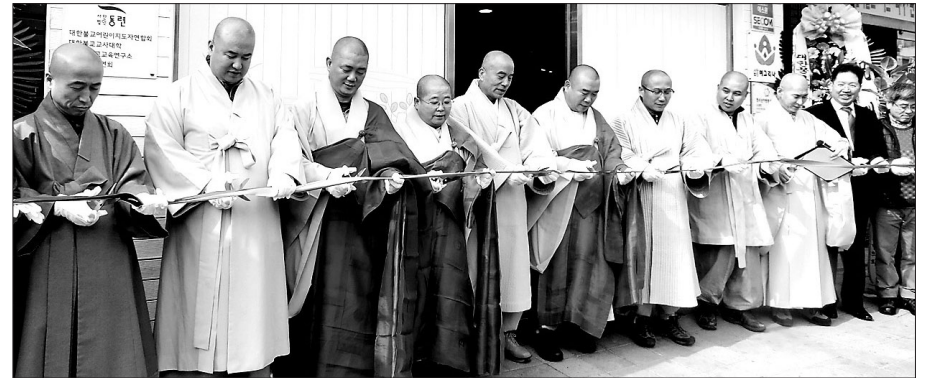
사단법인 동련은 2월 25일 부산 금정구 반송로 서동에 사무실을 개소하고 이전법회를 개최했다.