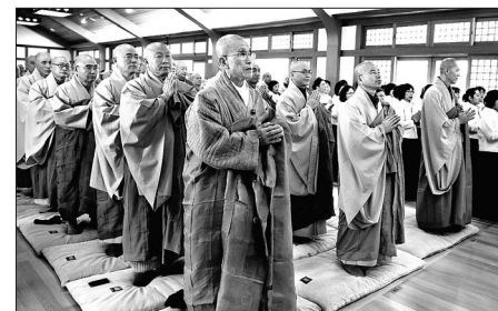
법정 스님 입적 4주기 추모법회가 2월 25일 성북동 길상사에서 열렸다.

'문명의 소도구로 전락하지 말자'는 주제의 법문에서 인간이 만들어낸 물질문명의 노예가 되지 말고 사람다운 몸과 여유를 잃지 말 것을 강조했다. 또한 법정 스님은 "순간순간에 감사하고 누릴 줄 알아야 한다. 순간을 수단시하고 살면 평생을 살아도 남는 게 없다. 목표를 좇아 급하게 달리지 말고 여유를 갖고 돌아갈 줄 알아야 한다"며 현대 문명 속에 여유를 찾을 것을 강조했다. 송광사 법흥 스님은 추모법문에서 "스님은 성격이 치밀하고 시간을 소중히 여겼으며 자신의 공부를 하려고 노력했다"고 회고