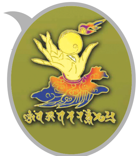
42수진언 족자 중의 '여의수주 진언' 확대사진