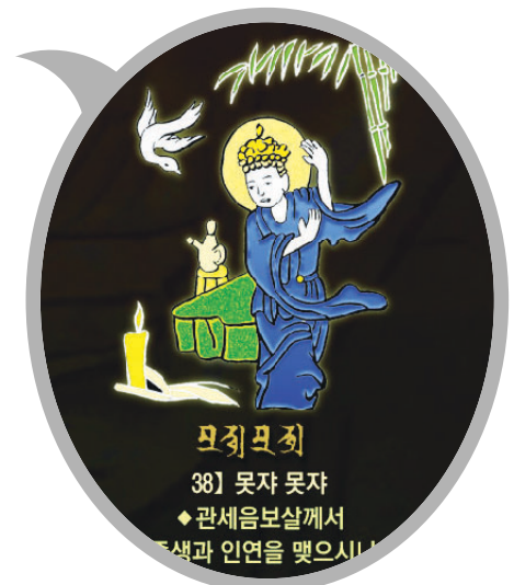
신묘장구 대다라니 족자 중의 '못자못자' 확대사진

법보시용으로 탁월하며 각 가정에 행운과 복을 선사합니다. 10개 이상 구매시 원하시는 문구를 새겨 드립니다.