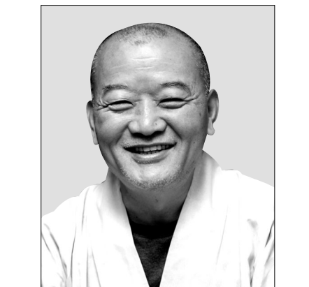
격오지 법당 보수 불사 추진 예비역 군승 활용 포교 전개

스님은 "군복무 시절 부대에 법당이 없어 개인교 종교행사에 참여해야만 해 찬송설계안을 작성할 계획이다. 향후 연대·사