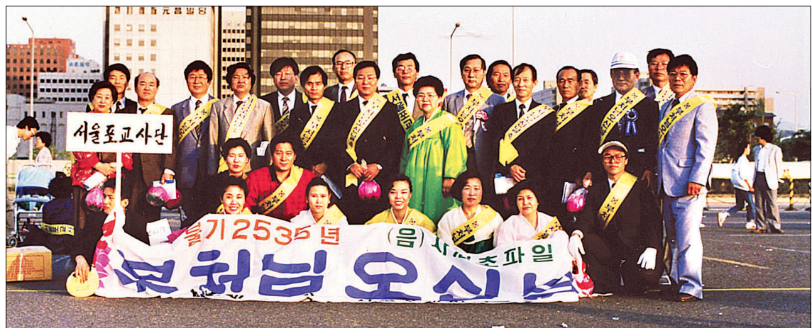
1991년 조계종 서울포교사단 여의도 봉축 행사 사진