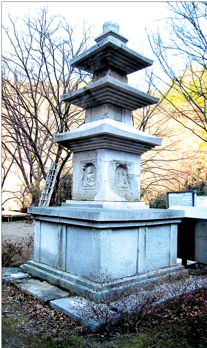
원광법사가 창건한 경주 삼기산 금곡사에 남아 있는 원광법사부도탑(사진 왼쪽)과 <삼국유사>의 원광사편. <삼국유사>에서 원광법사는 '의해(義解)' 편 의 첫머리에 나오는데 '의해'란 불법의 의리(義理)를 깨달아서 안다는 뜻으로 이는 원광법사가 바로 신라에서 최초로 불법의 요체를 터득한 승려였음을 의미한다.(사진 오른쪽)