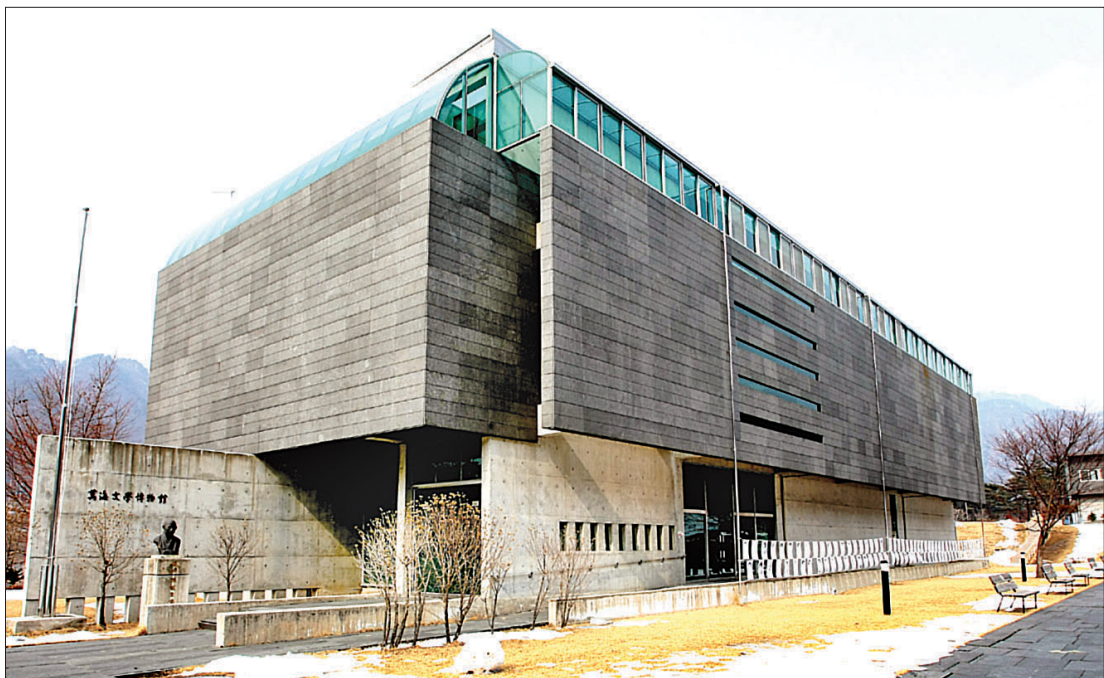
70평 규모의 만해문학박물관은 만해 스님의 저서와 유품 등 그의 일대기를 볼 수 있는 3층으로 된 전시공간이다.