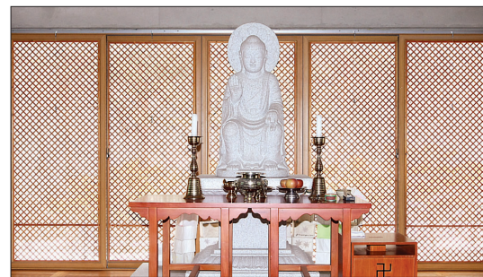
창살을 이용해 자연을 후불탱화로 이용한 서원보전