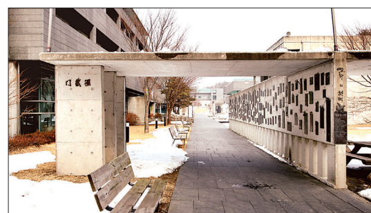
직선의 삶을 표현한 직선의 길과 일주문 격인 경절문

면이 길을 걸을 수밖에 없다. 모든 건물과 이어져 있기 때문이다. 알고 걷든 모르고 걷든 만해마을을 찾는 사람은 스님이 걸어간 길을 걷게 되어있는 것이다. 만해마을의 존재 이유를 실천적으로 옮긴 드라마틱한 도입이다. ‘만해마을’이란 건축에는 ‘길’이 포함되어 있다.