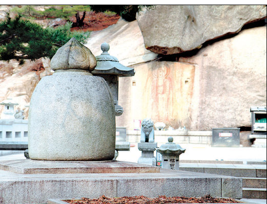
종형사리탑. 1988년 미얀마 마하시사사나 사원에서 아반디타 대승경으로부터 전수받은 사리 3과가 봉안됐다.