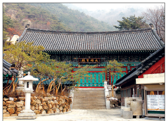
삼천사 대웅보전 모습

삼천사 뒤편에는 사모바위까지의 2.5km 구간의 탐방로가 개설돼 있다. 들머리에서 응봉능선을 이어 사모바위로 가거나 절을 지나 계곡 깊숙이 들어선 후 부암동 암문이나 비봉능선으로 길이 닿아 있다.