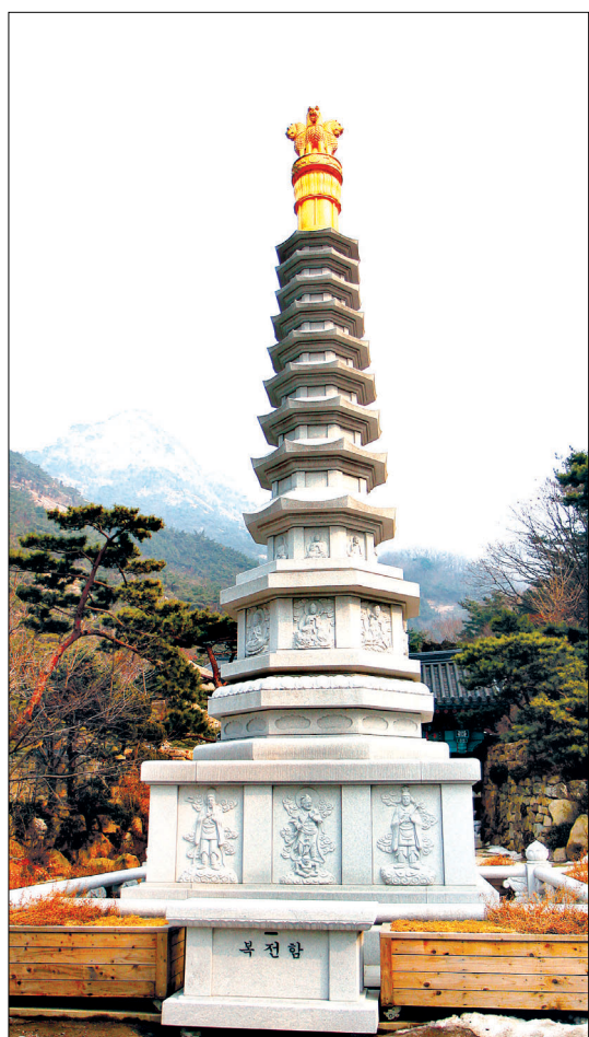
세존진신사리불탑은 월경사 8각9층탑과 아쇼카 석주4사자를 점목했다. 진신사리 7과와 금강경 600부 등이 봉안됐다.