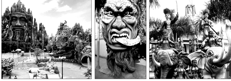
베트남 스이티엔 놀이공원에는 사천왕상, 코끼리 상등 불교식 조형물이 가득하다.

고 있는 장면을 연출해 섬뜩함을 준다. 놀이동산 곳곳에 불교에서 모티프를 얻은 조형물을 만들었고 심지어 불상도 봉안했다. 1995년 만들어진 이 공원은 개장 이후로 베트남이 대표적 관광지로서 자리잡았다. 둘러보는 데만 2시간이 걸릴 정도로 큰 규모는 박쥐 동굴, 지하터널 수족관, 악어 먹이 체험 등 풍부한 볼거리를 자랑한다. 유럽의 고성 등 서양식 테마파크와는 다른 독특한 분위기가 있다