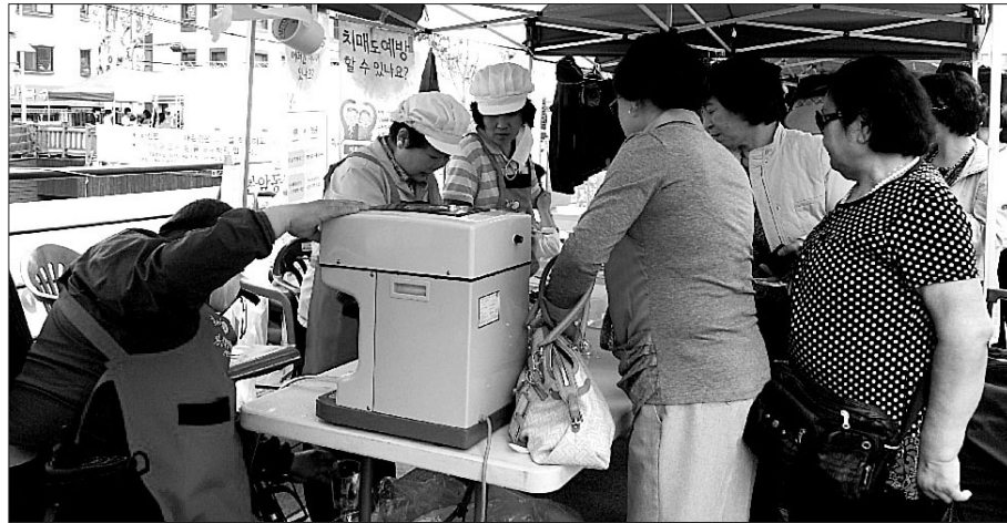
성북장애인복지관이 진행하는 ‘맛나행복 요리특강’ 회원들은 단순히 만들기 활동에서 머무는 것이 아니라 먹거리 장터를 열어 팔빙수 등을 판매해 얻은 수익금을 복지관에 기부하는 등 다양한 활동을 펼치고 있다.

구립성북장애인복지관(관장 현관)은 ‘맛나행복 요리특강’ ‘산행 스케치-등산’ ‘배드민턴’ 활동을 운영하고 있다. 이 가운데 ‘맛나행복 요리특강’에 참여하는 회원들은 베이커리, 한식, 디저트 등 다양한 메뉴를 만드는 시간을 가지며 외부로 환원하기