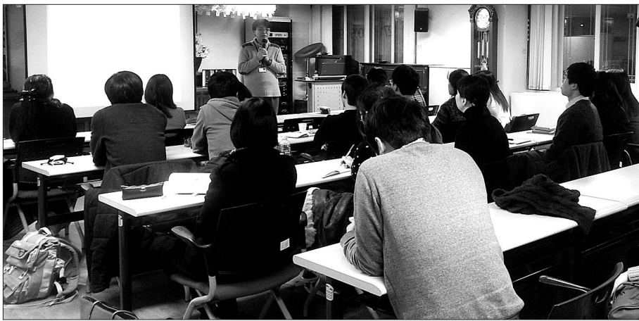
조계종사회복지재단이 ‘청년들을 위한 자원활동가 학교’를 진행하고 있다.